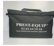
Packs matériel médical